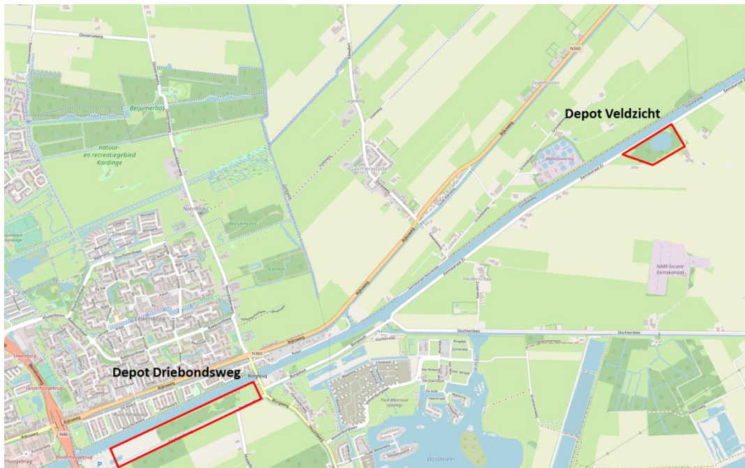
Figuur 1 Ligging van depot Driebondsweg en depot Veldzicht.